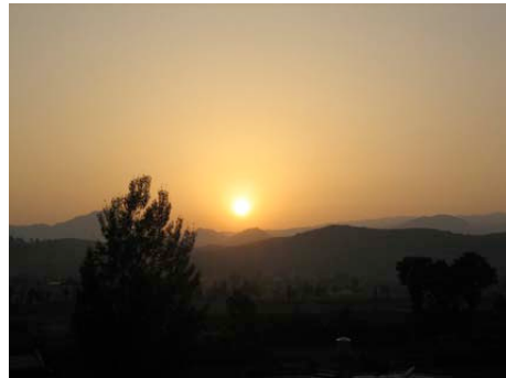
Bilden är tagen från vårt vardagsrumsfönster